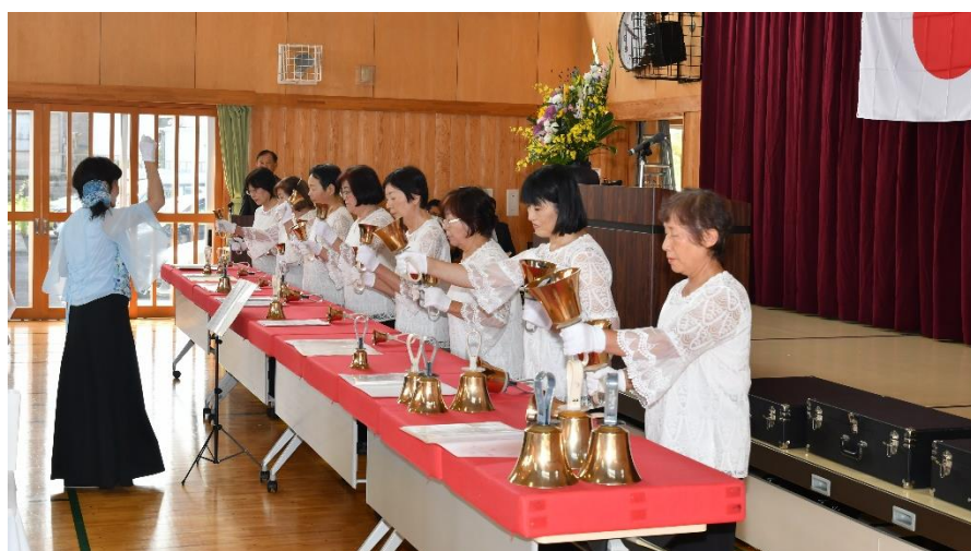
ハンドベル演奏 ティンカーベル

にちなんだ「重忠節」の舞を披露してくれました。さらに「野の花劇団」の皆さんが劇団として最初に公演を行った「安寿と厨子王」の演劇を上演しました。アトラクションの最後は「にじいろのタネ」という二人組のウクレレユニットによる「癒しのミュージック」でした。