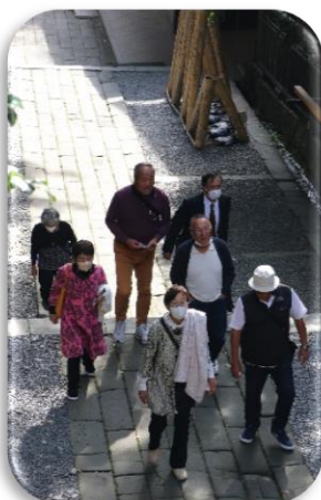
大河ドラマ館 静岡市歴史博物館 東照宮の石段

十月二十日、静岡市の浅間神社境内にある「どうする家康」の大河ドラマ館、静岡市歴史博物館、そして家康の墓所がある久能山東照宮が目的地です。