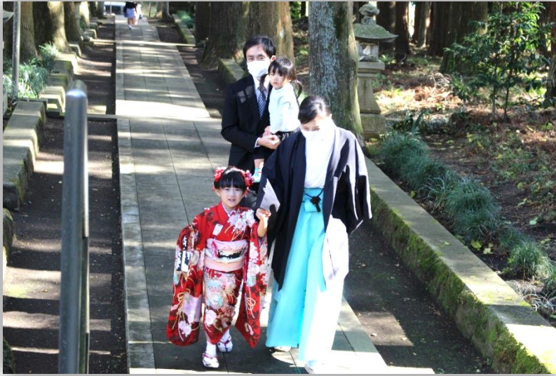
参道を 通って 神殿へ

十一月二十三日、来年少小 学校に入学する子どもたち を祝福する、「七歳児祝」の 式が浅間神社で行われました。