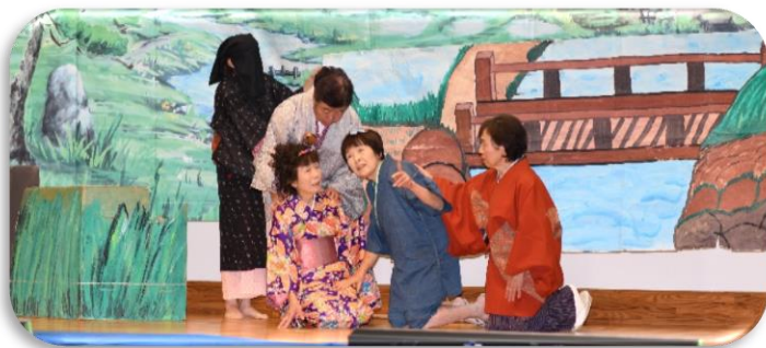
上 野の花劇団 下 愉快的仲間たち