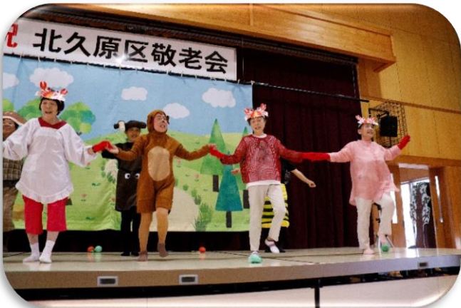
野の花劇団公演「さるかに合戦」