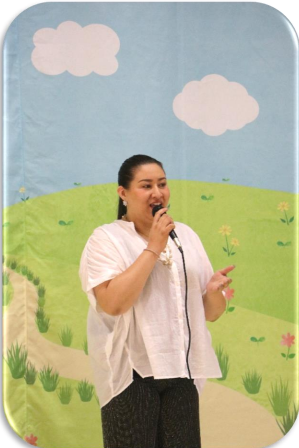
Shiinaさんによる 歌謡ショー