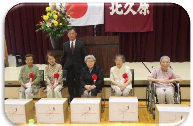
米寿を迎えられた方々に お祝い品を贈呈