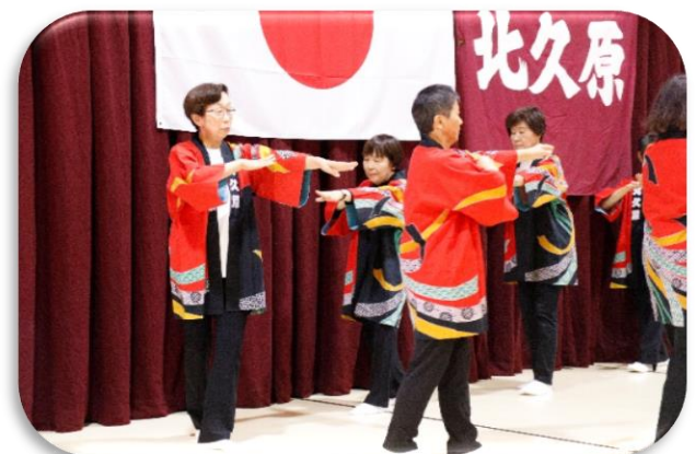
北久原民踊部による百万石音頭