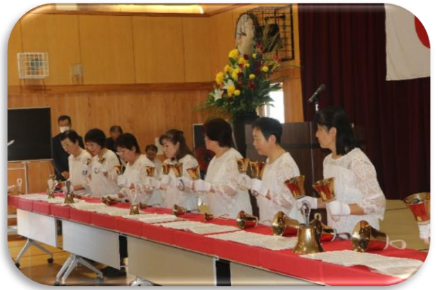
ティンカーベルによる オープニングセレモニー