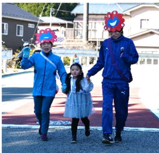
ひいばあちゃんと一緒に!!